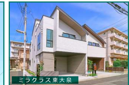
ミラクラス東大泉