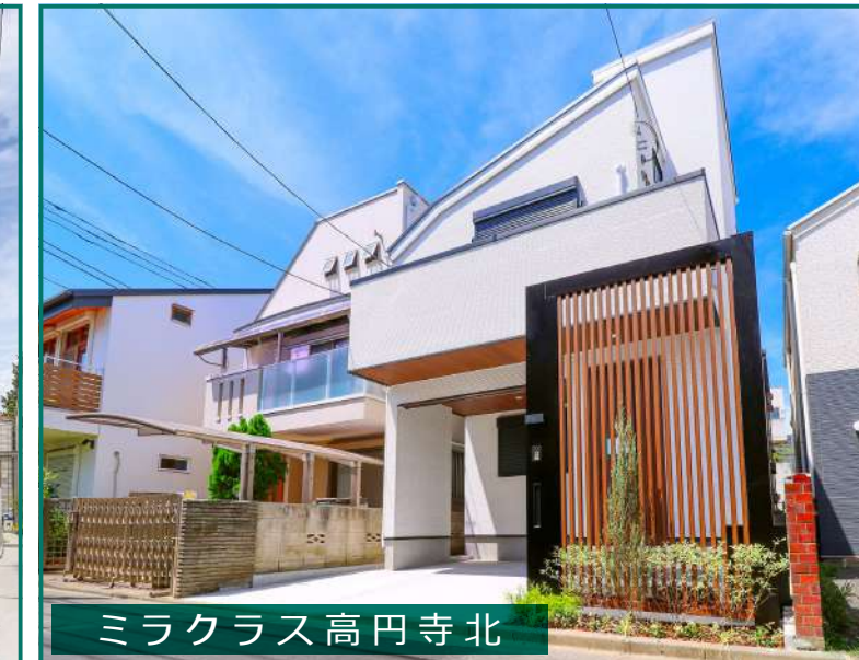
ミラクラス高円寺北