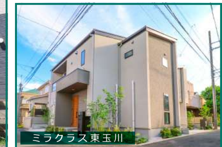
ミラクラス東玉川