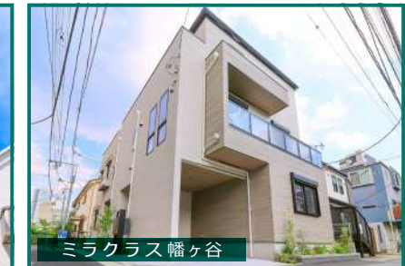
ミラクラス幡ヶ谷