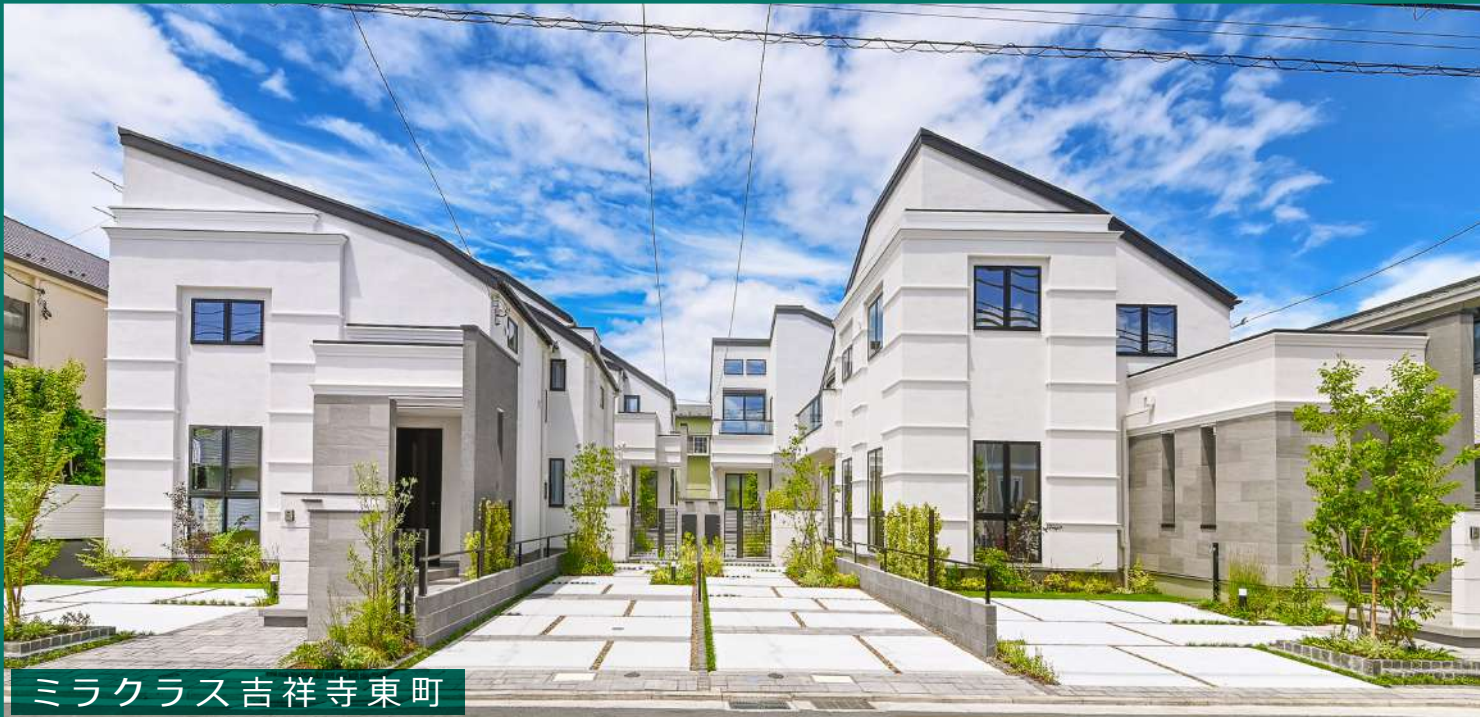
ミラクラス吉祥寺東町