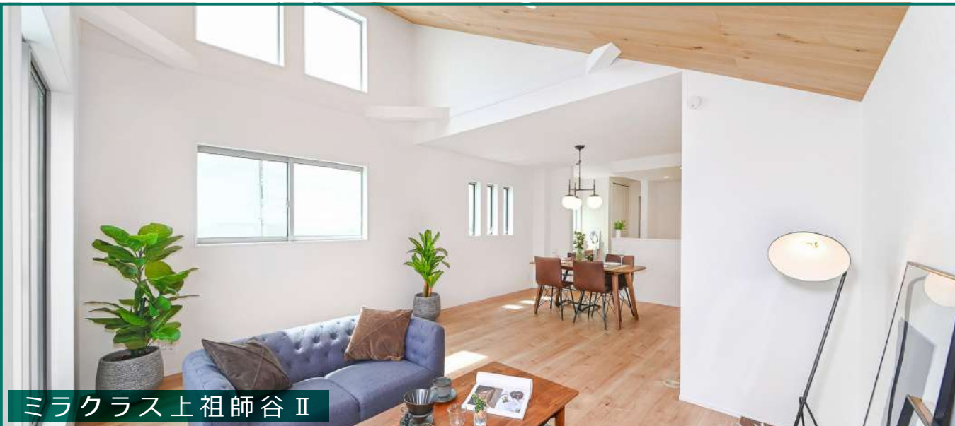
ミラクラス上祖師谷Ⅱ