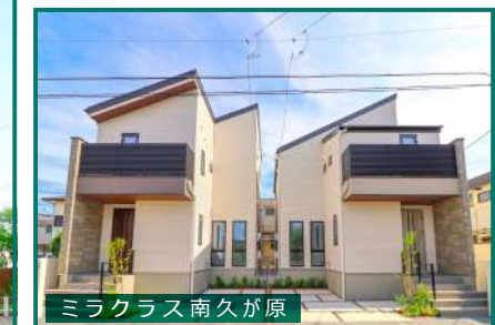
ミラクラス南久が原